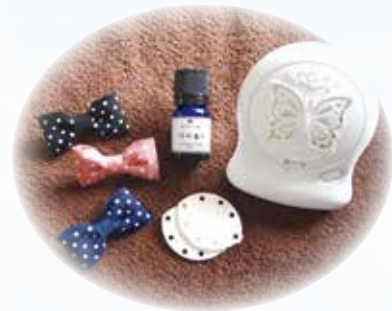
アロマリボン1つ ¥500~ / 芳香器 ¥1,980~

大きめの洗面器、またはバケツにお湯を入れ精油を1~2滴落としよくかき混ぜます。足を温めるだけで、次第にふくらはぎからひざ、全身まで温まっていきます。