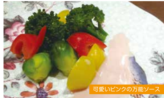
可愛いピンクの万能ソース