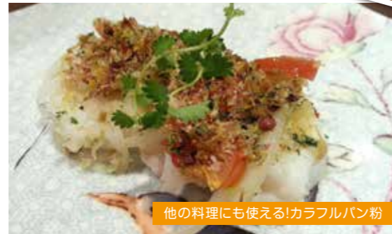
他の料理にも使える!カラフルパン粉

作り方 ①全ての野菜をオリーブ油で炒めて軽く塩胡椒で味をつける。②ソースは、白ワインにハイビスカスを入れて弱火でコトコトと1/3になるまで煮詰めハーブを取り出す。生クリームと塩・粒マスタード(好みに合わせて)入れひと煮立ちして少しとろみがついたら出来上がりです♡ソテーした野菜につけて召し上がってください。お肉にも合いますよ。