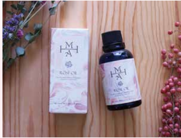
ローズシリーズのデザインは精油一滴が心、身体、肌に運ばれる様子を表しています。 50ml ¥5,200(税抜) / 専用スポイト(別売り) ¥200(税抜)

石垣島産パッションフルーツ種子油をはじめとする美容成分が加わり、不足しがちな肌の潤いを補います。配合する精油「ローズオットー」の香りもより豊かになりました。使う度に香りが心、身体、肌に浸透し強さとしなやかさを引き出してくれます。